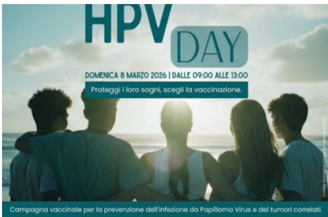
Campagna vaccinale per la prevenzione dell'infezione da Papilloma Virus e dei tumori correlati.